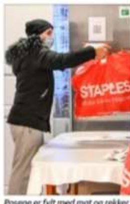
Posene er fylt med mat og rekker til én familie.